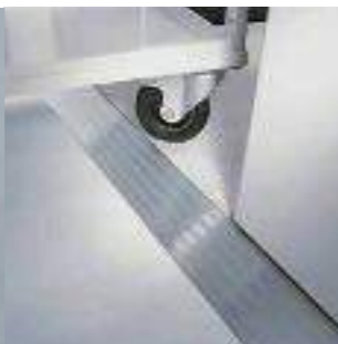
Pedana in alluminio conforme alle normative più recenti