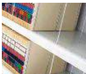
Aste in acciaio