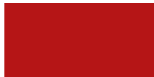
Upgrade a Compactus® Dynamic Pro