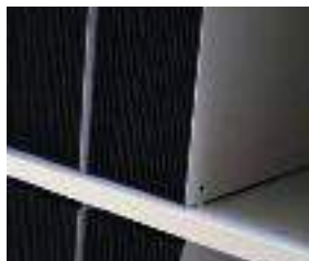
Pannello divisorio in acciaio