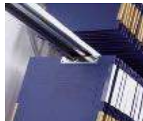
Telaio tipo Elba