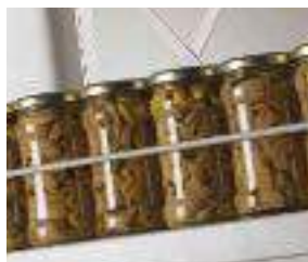
Profilo di contenimento frontale