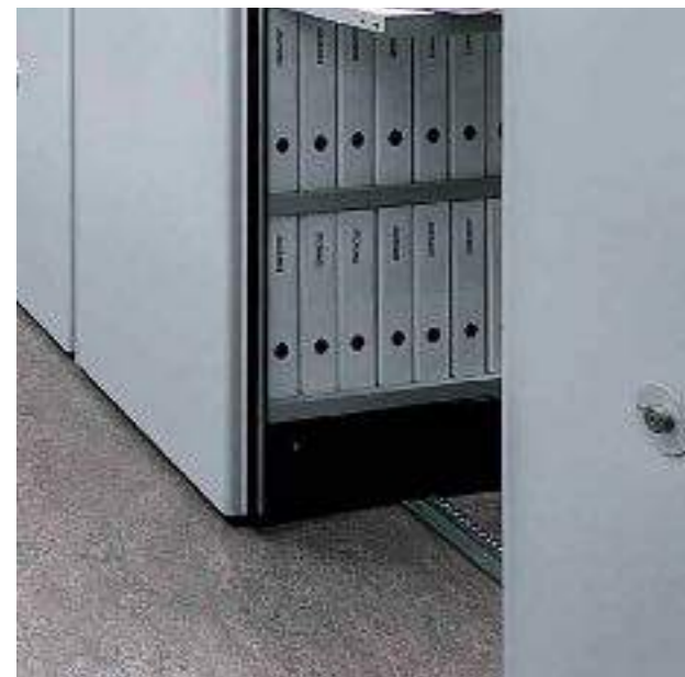
Rotaie incassate a pavimento