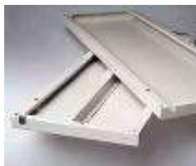
Profilo di rinforzo