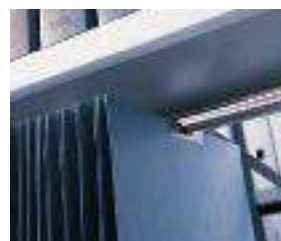
Binario per cartelle sospese ZT