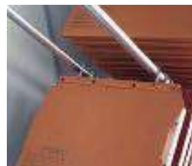
Telaio L'Obique / TUB