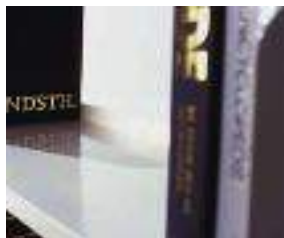
Battuta di arresto posteriore